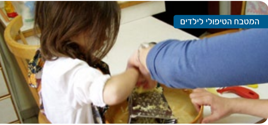
המטבח הטיפולי לילדים

בעיות אלו משפיעות באופן ישיר על תפקוד המשפחות ובעיקר על הילדים. מתן טיפול מקצועי בעלות נמוכה בסביבה המבינה את השפה התרבותית ומתחשבת בצרכים הספציפיים של הקהילה, מסייע למשפחות אלו להתגבר על הבעיות ולהביט קדימה אל עתיד טוב יותר. במכון קיימים טיפולים העונים על הצרכים שלהן כגון: טיפול פסיכותרפיה, טיפול קוגניטיבי התנהגותי, הדרכת הורים וקבוצות תמיכה. בנוסף, במידת הצורך יש שירות של פסיכיאטרית מומחית. המכון עובד בשיתוף עם העובדים הקהילתיים, המנהיגות הדתית ושירותי הרווחה של עיריית חיפה.